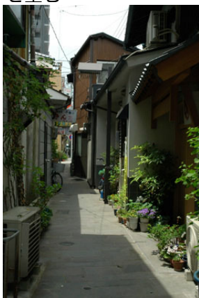
ナワテ横丁入口 ナワテ横丁入口方面 を望む