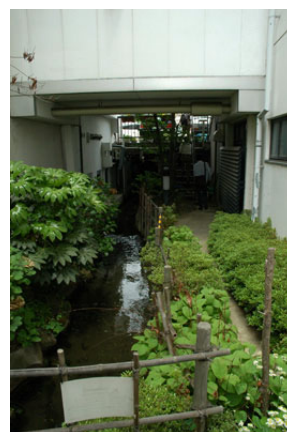
上土町の街並み 外堀小路の出口は左側 ホテルの中央に