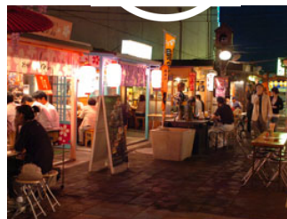
青森県八戸みろく横丁