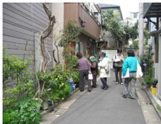
東京都墨田区向島地区 路地園芸調査 (2006.04)