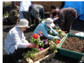
東京都北区十条地区 路地園芸トライアル (2006.03)