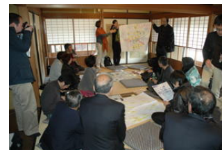
長野県長野市アフター サミット (2009.04)