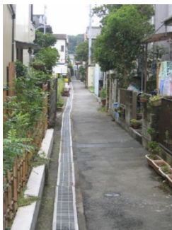
静岡県新居町の小路

路地のまちは、市街地の土地を有効に活用する考え方からは効率が悪く、火事や地震などの災害時には救急車や消防車が通れないなど、たくさんの問題を抱えていることも確かです。しかし、そのような開発効率や機能向上だけで、路地を消滅させてよいものでしょうか。路地のもつコミュニティを壊してよいのでしょうか。