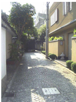
東京都新宿区神楽坂

路地(街なかの昔からの狭い道)のあるまちの多くは、安心して暮せるコミュニティが育っています。商店街では、狭い道に並ぶ店が賑わいある界隈を生み出し、住宅地においては子供の安全な遊び場であり、住民たちの井戸端会議の場であり、暮らしの場の延長です。