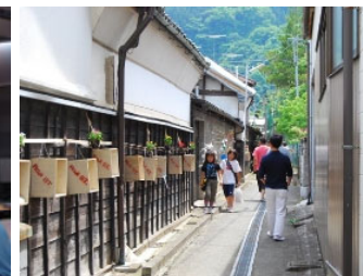
第1回路地St. (ロジスタ) 埼玉県小鹿野町 (2009.06)