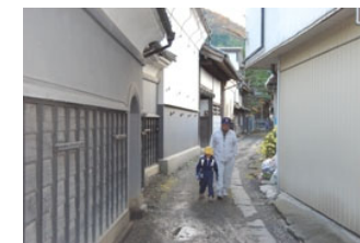
埼玉県小鹿野町小鹿野