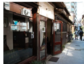
新潟市 (2010.10) 路地サミットまち歩き