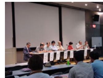
第2回全国路地サミット 大阪大会 (2004.08)