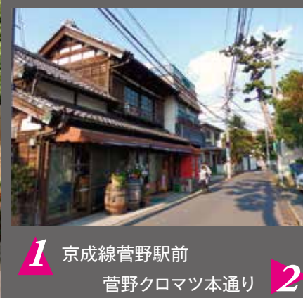
1 京成線菅野駅前 菅野クロマツ本通り