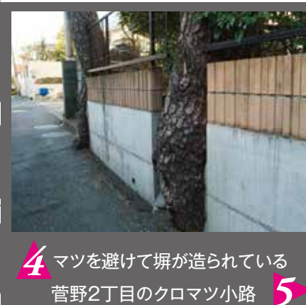
4 マツを避けて塀が造られている 菅野2丁目のクロマツ小路

菅野・平田・新田を歩く 〜クロマツのある風景〜 趣ある家々の佇まいと、 そびえ立つクロマツ木立。 市川 の原風景がここにある。