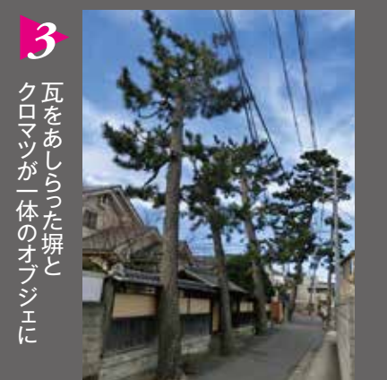
3 瓦をあしらった塀で クロマツが一体のオブジェに