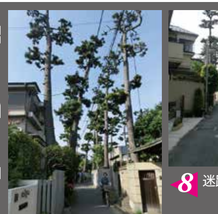
8 迷路のような新田の路地 セッパックで道路上に残されたクロマツ

足をのばせば... もっと散策を楽しみたい方は、京成線沿い、または千葉街道(国道14号)沿いを辿って、歴史と文化の薫る市川・真間・真間山エリアのコース(ウラ面)へ。また、春には、路に覆いかぶさる桜並木が見事に続く桜土手公園(文学の道)まで足をのぼしてみるのがお勧め。