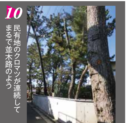
10 民有地のクロマツが連続して まるで並木路のよう

樹林地からなる約0.7haの平田緑地⑥は、市川の中でも、もっともクロマツの高木が群生しているところ。都市緑地法に基づく特別緑地保全地区として半永久的に保全されている。続いて新田1丁目の路々⑧を歩く。とにかく迷路のような路地がたくさんあるので、行き止まりには要注意!この