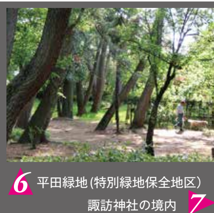
6 平田緑地(特別緑地保全地区) 諏訪神社の境内